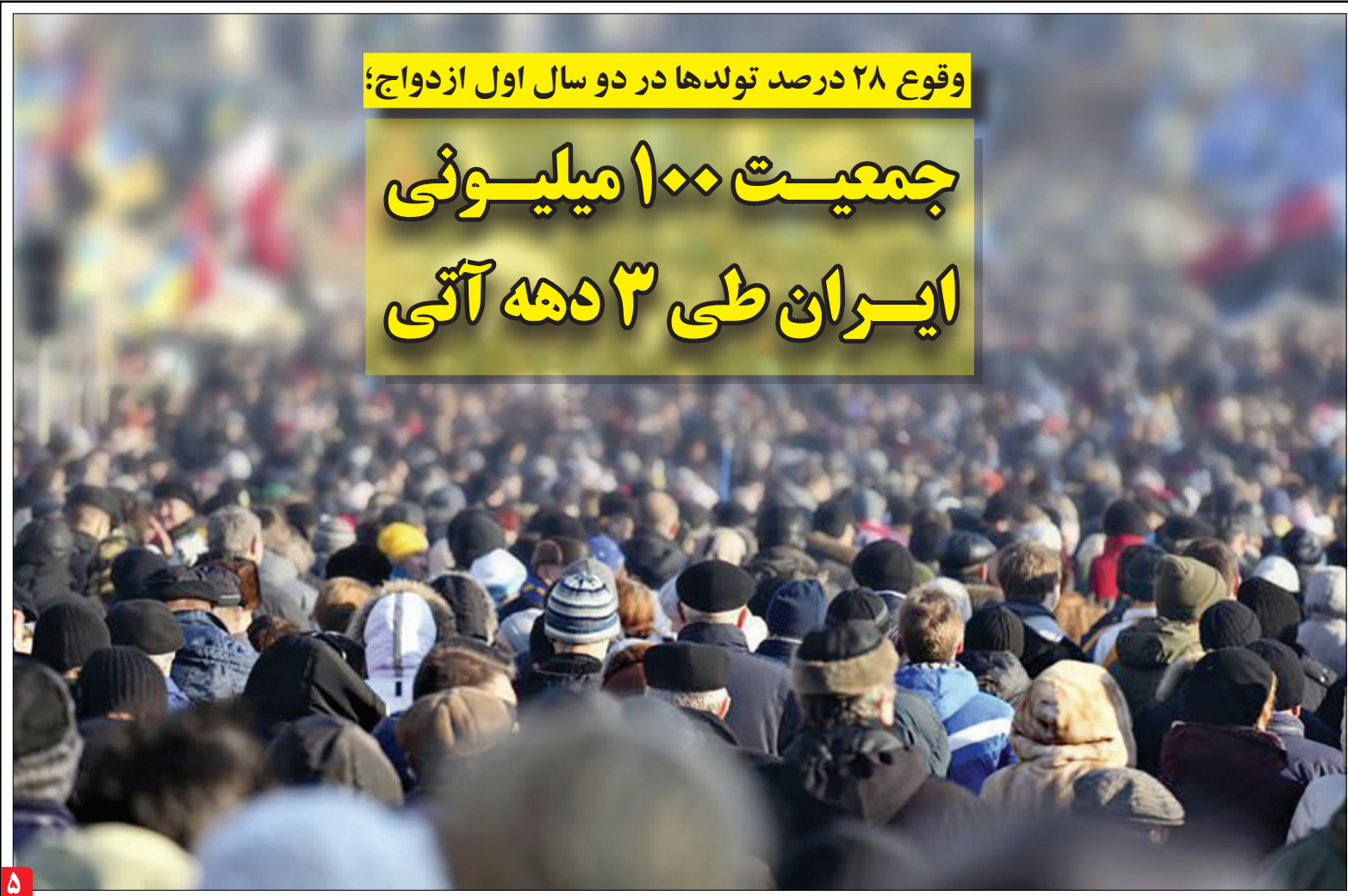
وقوع ۲۸ درصد تولدها در دو سال اول ازدواج؛

تحویل ۱۱ کیسه حاوی بقایای اجساد حادثه به پزشکی قانونی